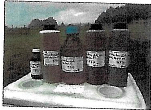
Fotografía 2: Set de Batería