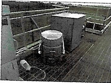
Fotografía 1: Instalación Equipo Automático